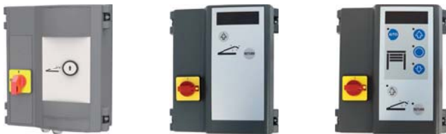
Classic Plus (standard)

Le niveleur de quai fonctionne avec le coffret de gestion: Classic Plus, inclus en standard. Les composants du système de commande sont conformes aux normes RoHS (sans plomb).