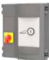
Classic Plus (standard)

Die Bedienung der Ladebrücke erfolgt über die mitgelieferte Steuerung Classic Plus. Die Bauelemente der Steuerung sind RoHS-konform (bleifrei).