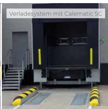
Verladesystem mit Calematic SC