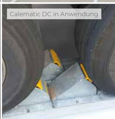
Calematic DC in Anwendung