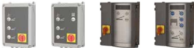
SuperVision 5 (standard)

Die Bedienung der Überladebrücke erfolgt über die mitgelieferte Steuerung SuperVision 5. Die Bauelemente der Steuerung sind RoHS-konform (bleifrei). Die i-Vision Steuerung ist optional erhältlich.